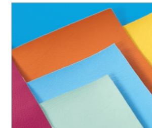
Vielfältige Farbvarianten in den Bezugsstoffen compact/premium