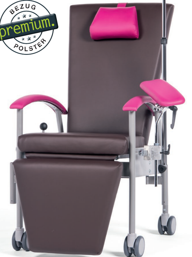
SITA in Premiummaterial Chocolate/Fuchsia mit Blutabnahme-Armauflage an der Normschiene und Infusionsstange im Halter